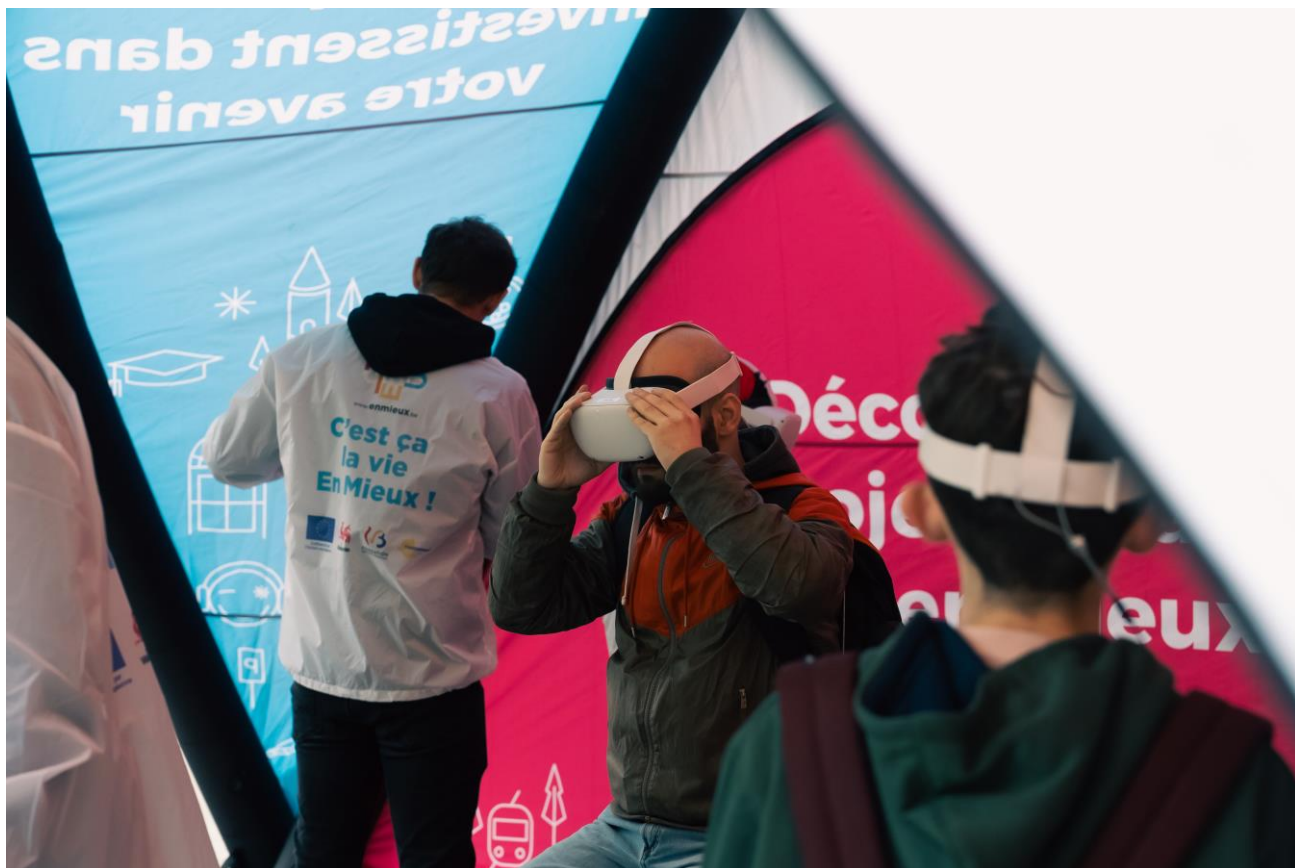
Des citoyens découvrent les projets européens grâce aux casques de réalité virtuelle.