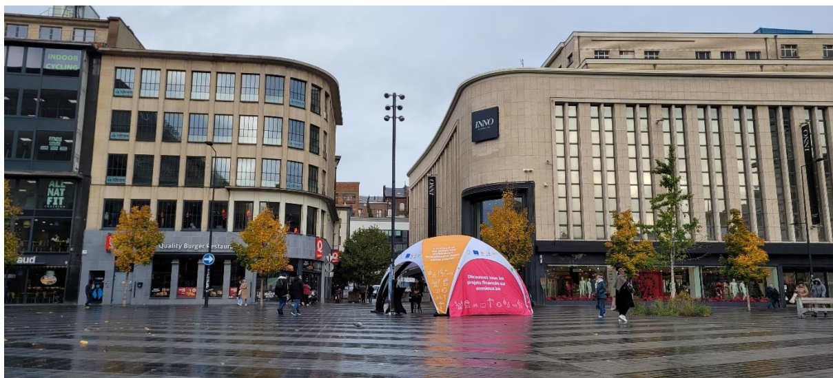
Le stand de réalité virtuelle installé dans la ville basse de Charleroi.

Ouvrez l'œil, l'expérience 3D s'invitera peut-être prochainement près de chez vous.